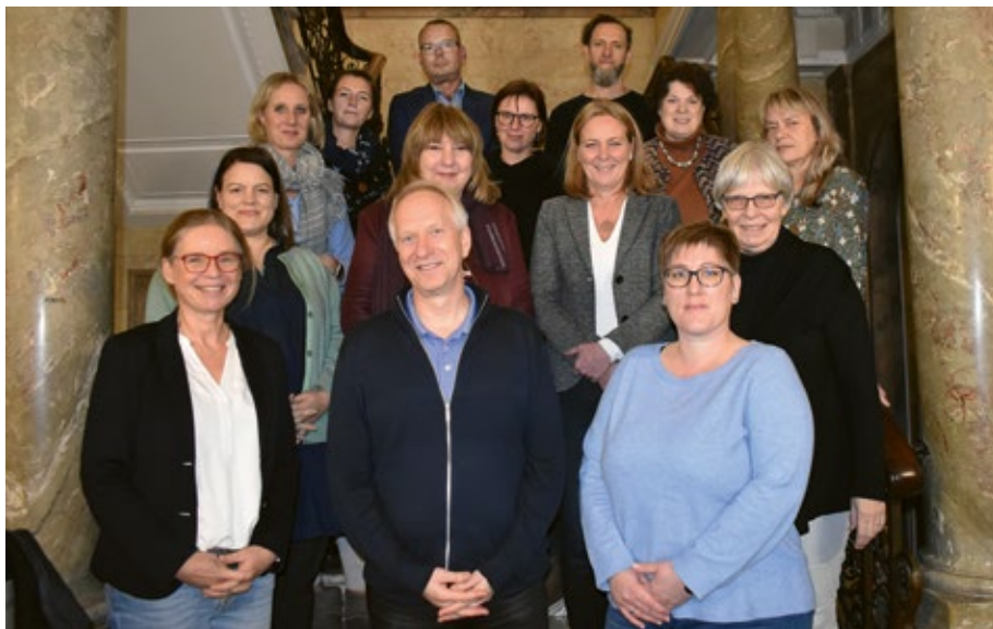
Mitglieder des Netzwerk Demenz Bergedorf